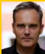
Regie, Text Erik Jan Rippmann

Bühnenbild Caroline Forisch Kostümbild Michaela Wuggenig Maskenbild Michaela Haag Lichtdesign Dimitri Macek Technik Gerald Samonig Bühnenbau Bernhard Kriebler Regieassistentin Lisa-Maria Sommerfeld Praktikantin Alina Novak Dramaturgie Martin Dueller Produktionsleitung Waltraud Hintermann Altersempfehlung 14+ Stückdauer 90 Minuten