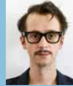
Regie, Bühne Martin Dueller